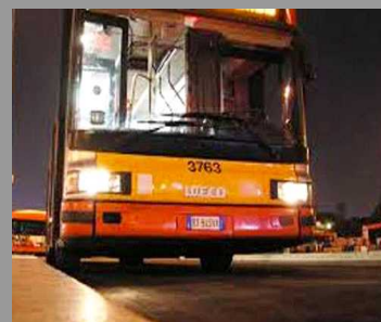
Tagli e aumenti, Roma trema. Sarà un bilancio lacrime e