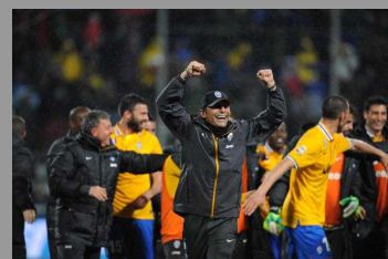
Juve, il Sassuolo le consegna lo scudetto...