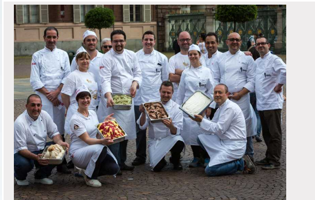
GUARDA LA GALLERY

Dalla crema con oli essenziali di limoni di Sorrento al gelato all'orzo antico con biscotto al grano del miracolo , dal gusto miele e zafferano al gelato all'amaretto fino all' amarascone (frutto ibrido tra ciliegia e amarena) aromatizzato con l' Amarone della Valpolicella . Le nuove tendenze dell'arte della gelateria, che verranno presentate a Gelato Festival 2014 , la manifestazione dedicata a cultura, innovazione e creatività del gelato, puntano su ingredienti genuini e di qualità, prodotti Doc, Igp, biologici e varietà a km 0 per offrire sensazioni e gusti inediti agli amanti del dolce freddo.